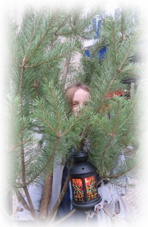
Stromeček z kola štěstí