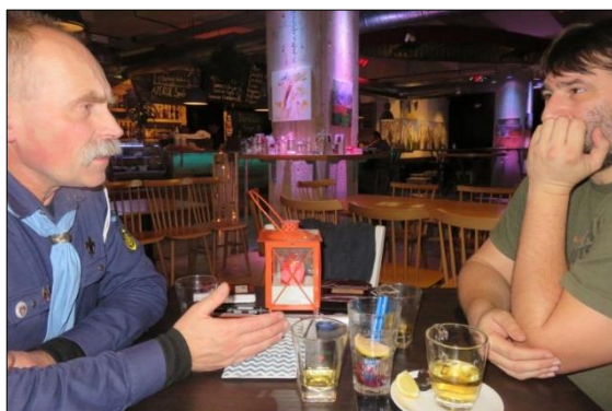
První diskuze o klubovně při Betlémském světle

Dosud jsme využívali klubovnu v sídle našeho skautského střediska na Sokolovské. O klubovnu jsme se dělili s jiným oddílem a nemohli jsme si ji tedy zařídit dle svého, řádně vystavit poháry z vydobytých vítězství a hlavně spousta táborového vybavení sídlila v garážích admirality či u Rádiovců, což při vší obětavosti už není dále možné ani praktické.