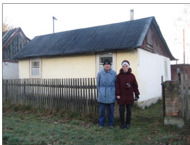
Klubovna a její původní majitelé.

Na začátku panelky vedoucí na loděnici jsou po levé straně tři chaloupky s lepenkovou střešou. Ta poslední je opravdu naše. Náš není pozemek pod ní a okolo ní. Ten patří městu a budeme za něj platit nájem zhruba 2000,- Kč/rok.