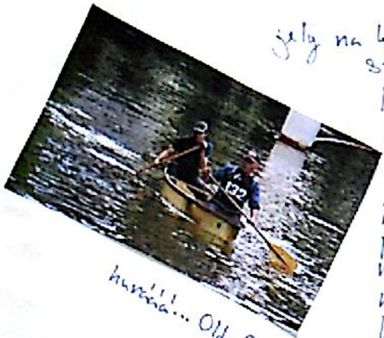
hurá!!!... Olda 800

Na startu jsme byli originálně jediný bez helmy. Když jsme vyjeli, tak jsme nabouraly dvě lodě. A potom jsme se dostali do vedení. I když jsme byly první tak na nás děje levice, "máme ty před náma dále?" 200m do cíle pár levice na ty, za náma že jeto 200m do cíle a to nás rozjelo. A byly jsme první o 10 sekund!! Kluci více předjeli všechny ale byli jediný ve své kategorii a tak měli smůlu. Dostali jsme (holky) výhram do vily (Chodiny, Lopatka), kvěm pro harmonický porok & patb... levice. Kluci dostali zelený loděky.