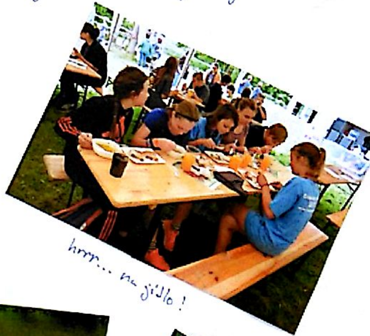
hrrr... na jídlo!