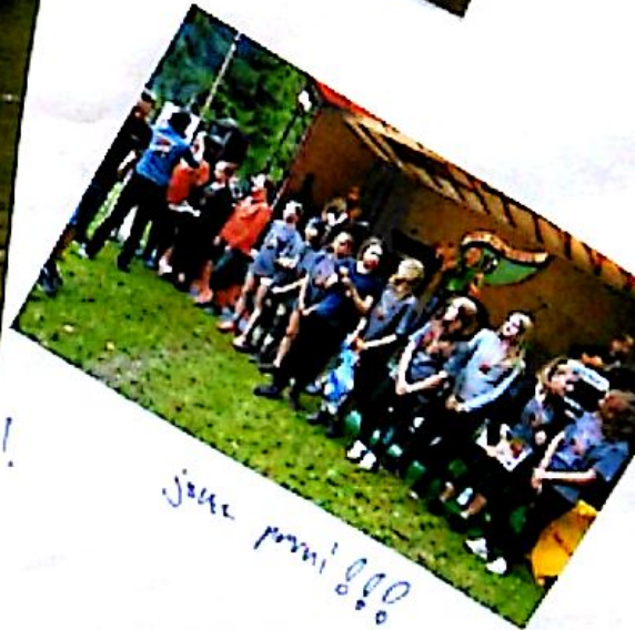
ještě první 800