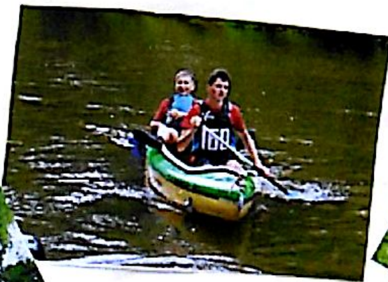
Kěb evidentně neměl!!!