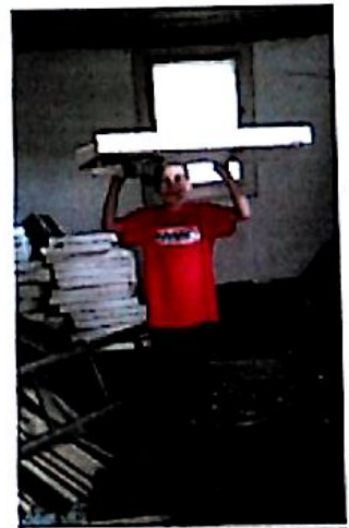
Emča se naučila i koučdit

Chvilku vám trvá, než přijde na nejlepší způsob skladání