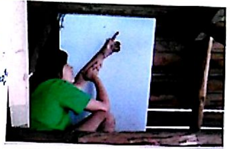
Pišť drží jako v život