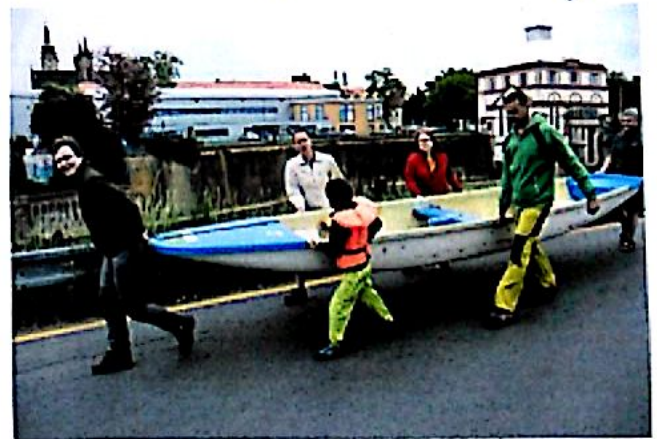
Převážení lodí na Moravském jezu za pomoci rodičů

Po překonání mnohaleté dotazů, kdy už bude šel, jsme nakolovali pod čmčovským jezem a rozdělili oheň. Na čmčovskou pauzu se na námi půjzela podívat i Renta a Kamíček. Šel byly přivítány s radostným a ještě s tím radost kamorádek, když Renta slíbila, že pokud to jen trochu půjde, tak se na chvíli stane sečor s bylarou.