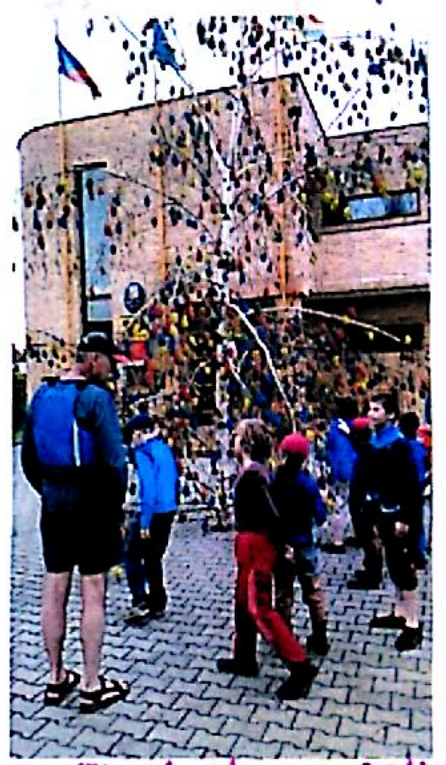
Vajíčkový strom v Dřetěti

Nocovali jsme na lonce v Němčicích. Za chvilky se kely staly 3 slany a v každém rohu byly fidele s těsnou omáčkou. Pro bonus každý dostal 1 párek a 1 rajčko. Po jídle, když rozsvítili světla a předost napimavím opávkám a přátelům se všichni natypili a vyhlédli kenta. Nakonec jsme se dočkali a v přírodním doprovodném bytí bylo moze kuzel zakončení dne.