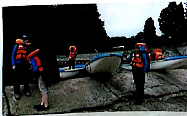
Na Opatovickém jezu jsme to už museli zvládnout sami