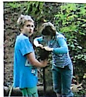
Krab s Majou chystají fagule.

Skautský slib jakožto slavnostní záležitost vyžaduje náležitou přípravu. Ne jinak tomu bylo letos na Javorce. Jakmile jsme dohráli vzrušující bojovou hru v lese, byl vyhlášen konec srandy, rozdělili jsme se na týmy podle šikovnosti, sympatií a jiných důležitých parametrů a dali se do práce. Místo slibu bylo letos výjimečně krásné – malý ostrůvek po lesním jeze, na který se šlo po lávce (která byla taktéž předmětem našeho odpoledního snažení). Javorka kolem ostrůvku docela bystře teče a tak krása tohoto místa nám dodala sílu a práce šla pěkně od ruky. Vytvořili jsme čtyřpatrovou pyramidu, řádne vycpanou chrundičkem, čtyři fagule čili pochodně a již zmíněnou lávku. A protože nás bylo dost a jsme nejen šikovní, ale někteří z nás mají i smysl pro krásu, podařilo se ohniště stylizovat do kompasové růžice a vkusně ozdobit šiškami a pilinami. Byli jsme s dílem spokojeni, jen někteří pesimisté se obávali, že ohniště tak krásné, že hrozí, že si na něm do večera někdo opeče bufty.