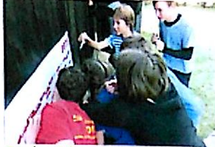
První vodák - úvodní hra