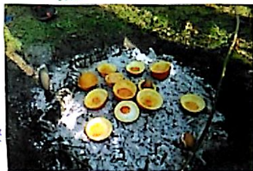
Veče v poněkudové střepe. Vpravo veče na turolo na dřevě.