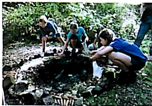
Ráno po slibu.

Kdo věří, že celý život vydrží na tato slova a tuto chvíli myslet, může se u ohně pustit do složení slibu. Oheň však ještě nehoří, stojíme potmě v kruhu kolem našeho ohniště a čekáme. Docela dlouho a pod košile se začne plazit chlad od noční řeky. Nikdo však nepromluví. Všichni čekají. Konečně na druhém břehu vyskočí plamínek, z plamínku je oheň, který se náhle rozhoří a prská a přibližuje se k nám. Hoří první fagule, na které plínáší Rádio oheň severu a z této světové strany také přiloží faguli k pagodě a pronáší slova o síle a odvaze. Po lávce postupně přicházejí ohňoví poslové z východu, jihu a západu. Narvalové zapálili čtvrtý slibový oheň Štik. Teprve teď je vidět, že za našimi zády visí státní i oddílová vlajka a všem je krásně vidět do tváří. Chlad je pryč a postupně slibují žabičky, vlčata i skauti. Mluví o tom, že budou plnit dobré skutky, milovat Českou republiku, ctít pravdu a lásku a nebudou se vzdávat. My zbylí jsme svědky a přejeme jim, ať se daří a nedají se odradit neúspěchy. Na závěr spojíme ruce v kruh a posílám stisknutí. Kdo ho ucítí, posílá ho dál. Slova „kruh se uzavřel“ končí celou slavnost a my se můžeme vrátit k loděnici.