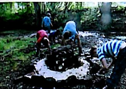
Slibové ohniště na ostrůvku pod jezem