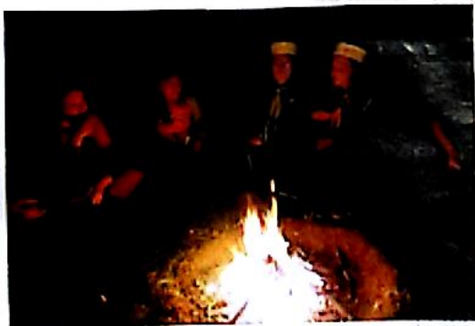
Večer u loděnice.