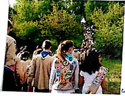
Časť na nášup...

Tretí den byl "HIPÉ" což bylo něco jako výlet. Na ten už jsme šli po skupinách jako minulý den šli jsme celý oddíl (celá výprava) a ještě se k nám přidal oddíl Německých skautů. Po cestě jsme plnili úkoly na stanovištích jako minulý den.