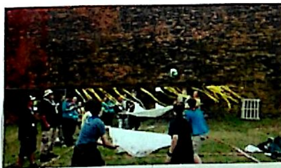
Nejlépe stanoviště a nejlépe hra Blanketball

Večer byl i Food Festival, kde každá výprava měla uvést jídlo kupte pro jeho návod a opravdu nějaká jídla stála za to!