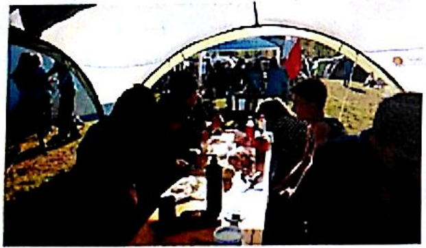
Príprava na Food Festival

Čtvrtý den jsme šli na kuchařský nášup a botaniku, která byla také v angličtině. Potom nás už čekalo jenom si zabavit věci, naložit se a pak i ešte do minibusu a jelo se domú.