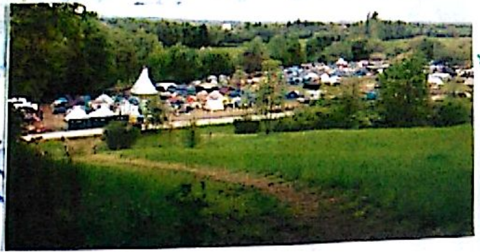
Príhľad do táboriska