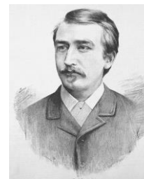
Hudba: Karel Kovařovic

Junáckou hymnu používáme při junáckých slavnostech a chováme se při poslechu či zpěvu obdobně jako při poslechu státní hymny.